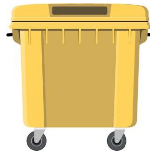
Cassonetti 1.100 lt