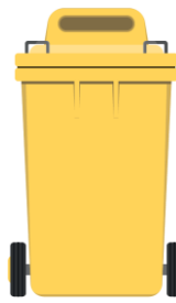
Carrellati 120/240/360 lt